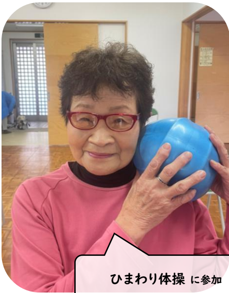
ひまわり体操に参加