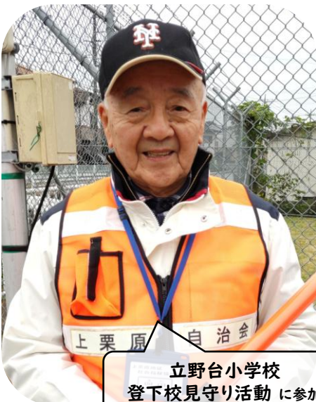
立野台小学校 登下校見守り活動に参加