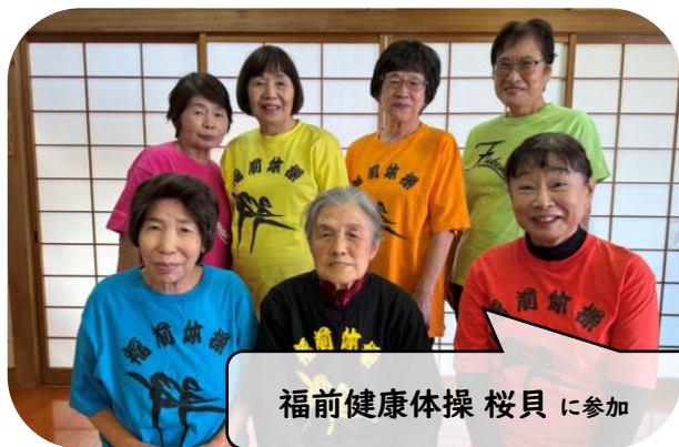
福前健康体操 桜貝 に参加