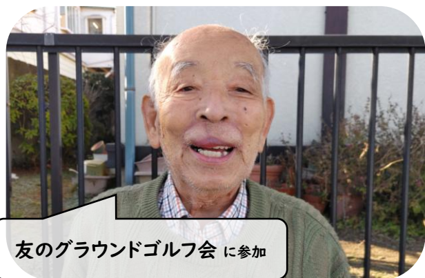
友のグラウンドゴルフ会 に参加