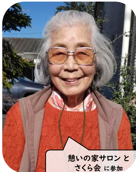
憩いの家サロンと さくら会に参加