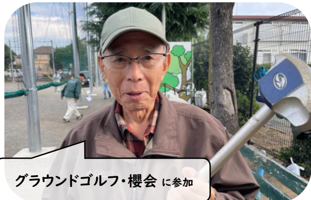
グラウンドゴルフ・桜会 に参加