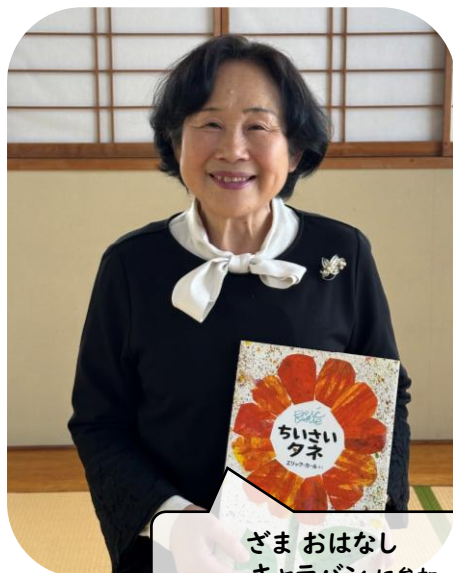
ごま おはなし キャラバンに参加