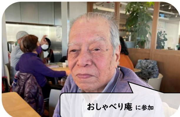
おしゃべり庵 に参加