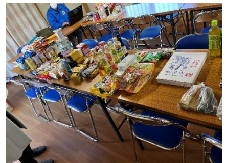
星の谷公民館に集った食材の数々

11月27日の役員会で参加を決定し、実施日を12月4日としたことから、準備期間及び会員各位への周知が4～5日と大変短期間でのお願いとなり、募集の食材が集まるか不安だったのですが、18名の方から153点もの食材の提供を頂きました。ご協力ありがとうございました。