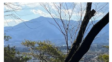
三峰神社参道より大山を望む

自治会では、随時自治会員を募集しております。各地区の自治会長までお気軽にご連絡ください。いざと言うとき（災害等・たすけあい）のためにも地域と繋がりを持ちましょう。