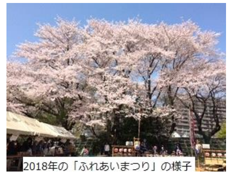
2018年の「ふれあいまつり」の様子

梅の花が家々の庭で咲き始めましたが、まだまだ寒い日々が続いております。星の谷地区社会福祉協議会では、例年3月最終土曜日に「ふれあいまつり」を明王第二公園にて開催してきましたが、令和2年からは新型コロナウイルス感染症の影響で中止となっております。今年度実施するとしても、それなりのコロナ対策を催した上で実施を考えておりますが、行動制限がなされた上での実施には否定的な意見が多く、2月22日に本部役員会を開催し、本年度の開催は困難と決し、中止とする事と致しました。来年度こそ桜の木の下で、会員皆様と交流できる日を楽しみにしたいと思います。