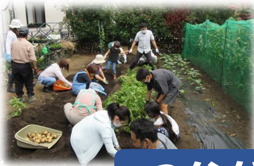
* みんなでつくる農園 (東原)

人と会うこと・外出できることが当たり前だと思っていたけれど・・・ コロナ禍であらためて、人との出会いやコミュニケーションなどの大切さを感じています。