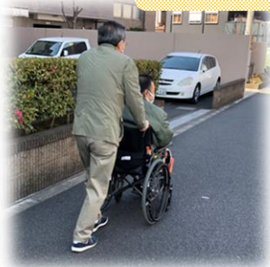
* 買い物同行 相模が丘ふれあいネットワーク