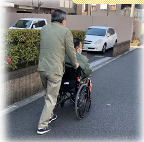
* 買い物同行 相模が丘ふれあいネットワーク