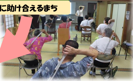
* おしゃべりキャラバン (栗原中央)