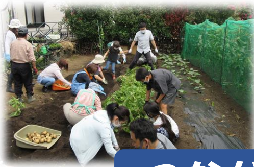
* みんなでつくる農園 (東原)

人と会うこと・外出できることが当たり前だと思っていたけれど・・・ コロナ禍であらためて、人との出会いやコミュニケーションなどの大切さを感じています。