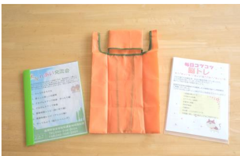
左から、暮らしに役立つ情報ファイル、エコバッグ、脳トレ問題

お届けの方法は、入谷第二地区では地区社協の運営委員がご自宅にうかがって手渡しとさせていただきます。そのさい、おひとり暮らしの方と運営委員とが対面で言葉を交わし、小さな「ふれあい交流会」ができれば幸いです。