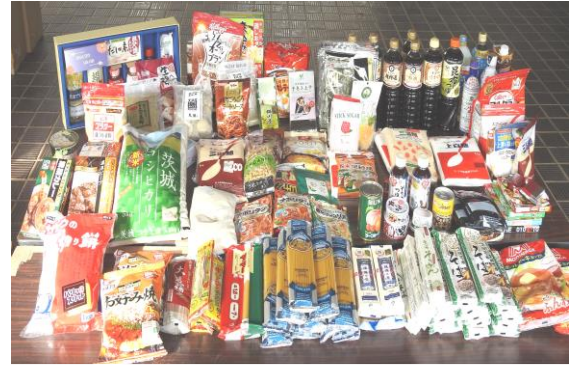
寄付された食料品の一部