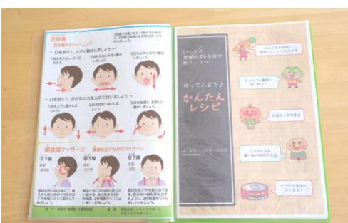
情報ファイルには、簡単な体操やレシピの紹介も