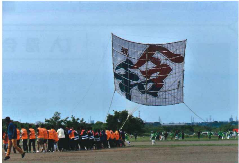
座間市大凧まつり (2019.5.5)

平成から令和に改元される直前の4月19日(金)今年度総会をサニープレイス座間会議室で開催。入谷第二地区自治会連合会の会長も参加され、議長の進行により、すべての議案が承認されました。ありがとうございました。