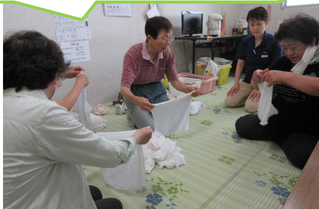
福祉施設でのボランティア体験

ボランティアには人と関わる活動や 作業中心、趣味を活かした活動など、 いろいろな形があります。