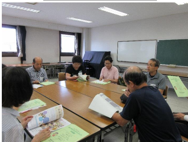
ボランティア講座